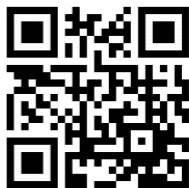
Scan me! Produktvorstellung